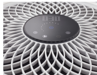
UVCA200 UV-C Floor standing air unit