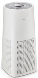
UVCA200 UV-C Floor standing air unit